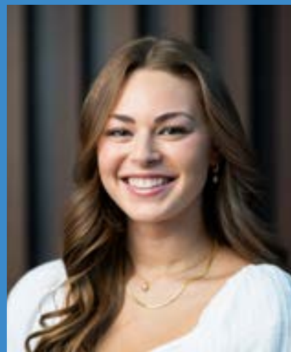
Claire Miranda Quarto Anno Canto Lirico